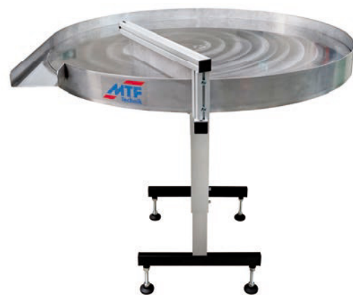
Akumulační stoly MTF