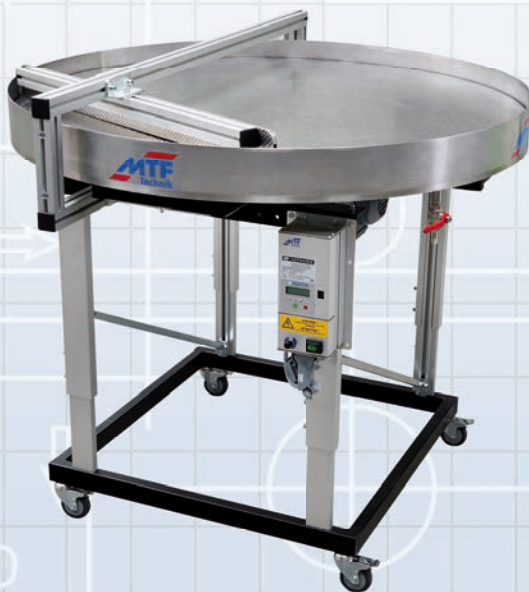
Akumulační stůl MTF