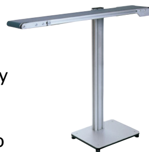
MTF I-Tech Typ IL