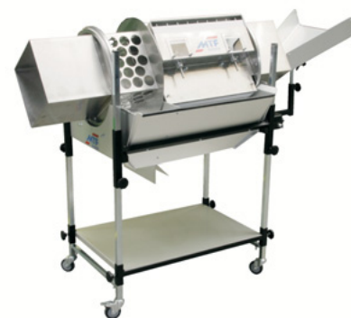
Kombinace obdélníkového a perforovaného bubnu