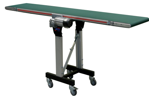
MTF I-Tech Typ IL