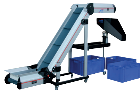
MTF Multi-Rounder MR-A1