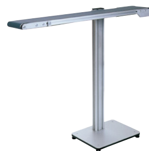
MTF I-Tech Typ IL