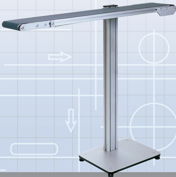
MTF I-Tech Typ IL