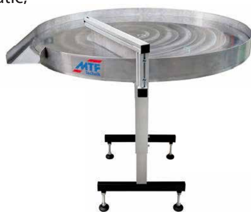
Masă de acumulare MTF