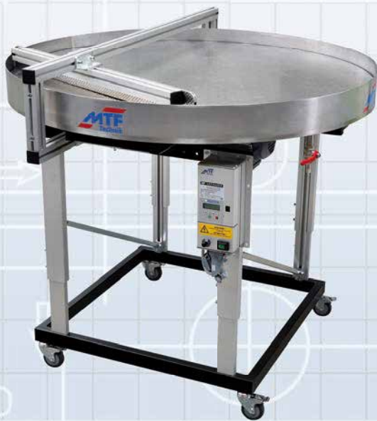
Masă de acumulare MTF