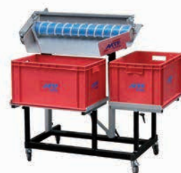
MSL 800 cu suport cutie