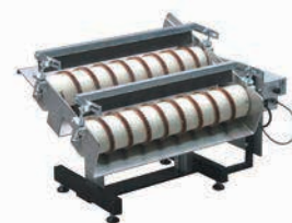
MSR 600 cu șurub dublu pentru piese turnate