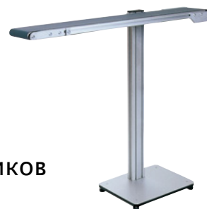
MTF I-Tech Typ IL