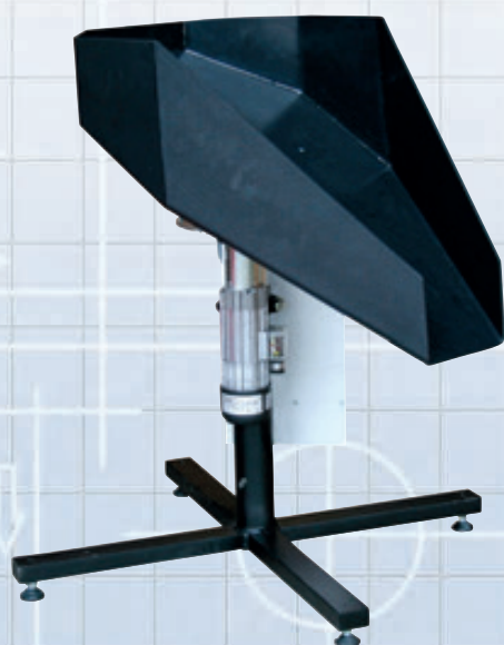
MTF Multi-Rounder MR-S1