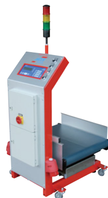
MTF Multi-Scale WT 0-60/20