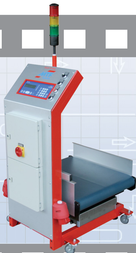
MTF Multi-Scale WT 0-60/20