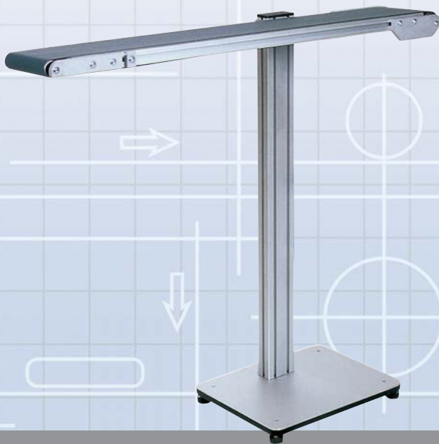
MTF I-Tech Typ IL